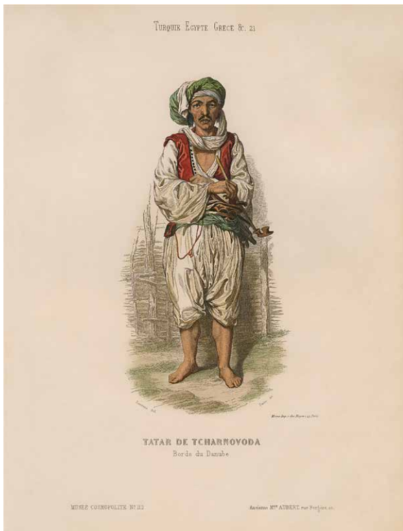
Lithographie Tatar de Tcharnovoda

Als Jahressgabe 2018 erhalten Sie eine Replik einer historischen Lithographie mit dem Titel Tatar de Tcharnovoda aus einer Ausgabe der „Zeitung für das Lachen“, in der eine Reihe von „Kostümen von verschiedenen modernen Völkern“ vorgestellt wurden. Auf Blatt 112 wurde ein Pfeife rauchender Mann aus den nicht näher bezeichneten Regionen Türkei, Ägypten und Griechenland gezeigt. Als Quelle wird der Verlag Ancienne Maison Aubert in Paris um das Jahr 1860 angegeben.