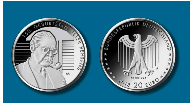
Gedenkmünze Peter Behrens mit Pfeife

Die Bildseite zeigt den Architekten Behrens vor einer Abstraktion seines prominentesten Industriebaus, der legendären Turbinenhalle in Berlin. Die leichte, leicht gesperrte Schrift steht formal für die Schaffensperiode des Jubilars.