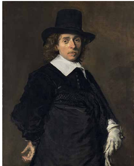
Adriaen van Ostade, Porträt von Frans Hals

Die Bilder der zweiten Periode charakterisieren außer der Helldunkelwirkung die Naivität der Auffassung und einen gemütvollen Humor. Die Bilder der dritten Periode (meist Interieurs mit Figuren) sind durch sorgsame Durchführung bei hellem, leuchtendem Ton ausgezeichnet. Gemälde von ihm befinden sich in den Galerien zu Berlin, Dresden, Wien (kaiserl. Galerie, Liechtenstein), Paris (Louvre), München (Pinakothek), Amsterdam, in Den Haag und St. Petersburg. Ihre Zahl beläuft sich auf etwa 400.