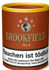
BROOKFIELD No. 4 (Black Bourbon), 200g

Sorgfältig ausgewählte Importtabake aus den besten Anbaugebieten der Welt ergänzen sich zu einer ausgewogenen Mischung, die mit dem fruchtigen Aroma reifer Kirschen veredelt wird.