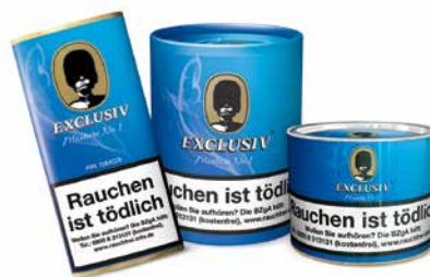
EXCLUSIV Mixture No. 1 (Royal), 50g, 100g, 200g

Für diese traditionelle amerikanische Mixture verwenden wir nur handverlesene Virginia- und Burleytabake aus den besten Provenienzen North Carolinas und Virginias. Abgerundet wird diese Mischung mit einem Schuss Straight Bourbon für einen vollendeten Genuss.