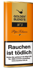
GOLDEN BLEND'S No. 3 (Amaretto), 50g

Eine sehr aromatische Mischung aus handverlesenen Virginia-, Burley- und Black Cavendishtabaken. Sehr fruchtig und süß mit dem Geschmack der Schwarzkirsche. Die Schnittart „Wild Cut“ bringt den Charakter der einzelnen Tabake besonders zur Geltung.