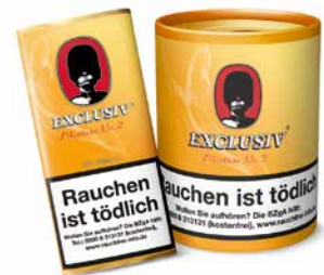
EXCLUSIV Mixture No. 2 (Wild Mango), 50g, 200g

Ein wahrhaft königlicher Tabak. Sehr duftiges Aroma. Durch das nach der Pressung aufgelockerte Granulat kommen die süßen Virginia-, aromatisch gerösteten Burley- und die würzigen Orienttabake ideal zur Geltung.