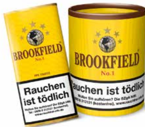
BROOKFIELD No. 1 (Aromatic Blend), 50g, 200g

Seit dem Inkrafttreten der TPD2 im Mai 2016, sind Abbildungen oder Beschreibungen des für Pfeifentabak charakteristischen Aromas verboten. Zur leichteren Orientierung haben wir Ihnen hier exemplarisch eine Aufstellung aller Pöschl-Pfeifentabake mit der dazugehörigen Kurzbeschreibung zusammengestellt.