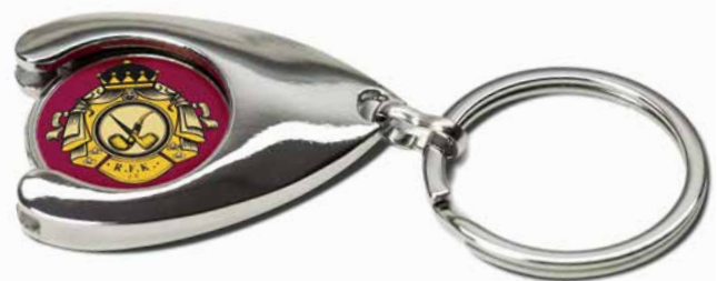
Schlüsselanhänger mit Einkaufschip

Mit dieser Ausgabe der RFK-ClubNews erhalten Sie zusätzlich einen Schlüsselanhänger mit Einkaufschip im RFK-Design.