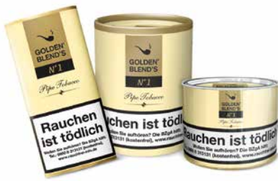
GOLDEN BLEND'S No. 1 (Vanilla), 50g, 100g, 200g

Eine Mischung aus handverlesenen Virginia- und Burleytabaken, geschnitten nach Wild Cut-Art. Eigenständige und angenehme Duftnote mit dem Geschmack der exotischen Vanille.