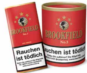
BROOKFIELD No. 3 (Cherry Blend), 50g, 200g

Dieser Pfeifentabak hat durch das deutliche Vanille-Aroma eine sehr angenehme Duftnote. Aromatische Burley-, goldene Virginia- und Black Cavendishtabake verleihen dieser Mischung ihren besonderen Geschmack. Ein Genuss für alle Sinne.