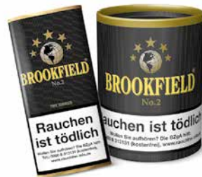
BROOKFIELD No. 2 (Black Vanilla), 50g, 200g

Eine angenehm aromatische Mischung aus Virginia-, Burley- und Javatabaken, verfeinert mit einem dezenten Vanille-Aroma. Ideal auch geeignet zum Mischen mit anderen Pfeifentabaken für Ihr ganz persönliches Geschmackserlebnis.